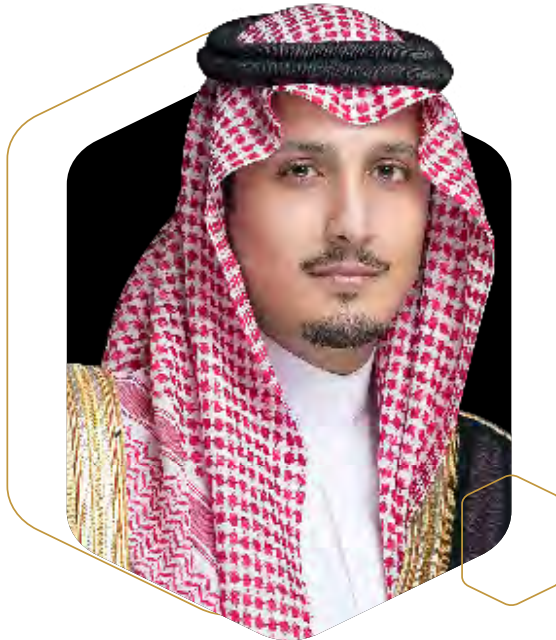
صاحب السمو الملكي

الدكتور محمد بن محمد بن سليمان بن محمد العزيز آل سعود